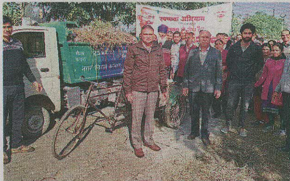
करनाल की सीएसएसआरआइ में सफाई अभियान चलाते वैज्ञानिक व अन्य • जागरण

जागरण संवाददाता, करनाल : केंद्रीय मृदा लवणता अनुसंधान संस्थान (सीएसएसआरआइ) में स्वच्छता अभियान चलाया।